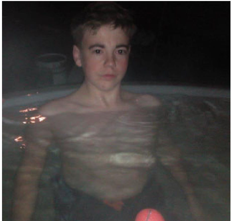
En velfortjent tur i stampen etter endt nattdykk.