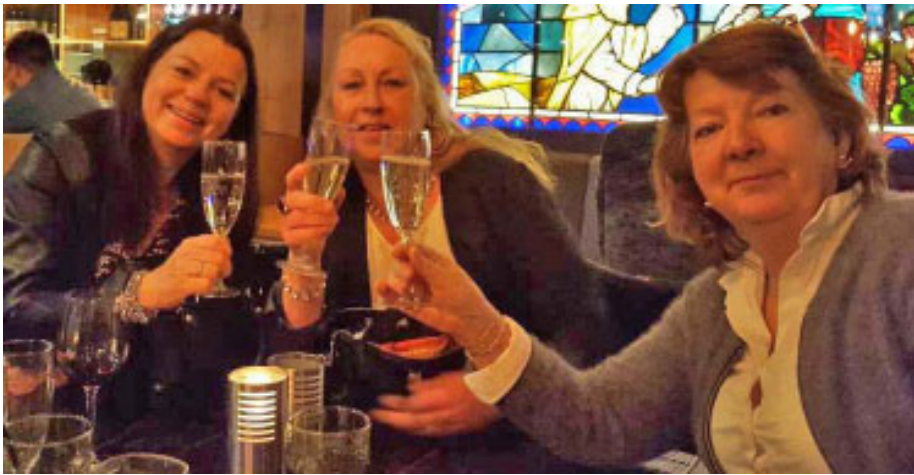
Ordentlige damer drikker sjampis.

og cognac. Julegaverne blir nok små i år (også).